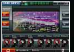
■サウンド・シェイパーⅡ画面

作りたい音色のイメージに近いトーンを選ぶと、画面上には、そのテンプレートの厳選されたパラメーターだけがスタンバイ。簡単なつまみ操作や画面上のボタン操作だけで、プロのサウンド・デザイナーの行うポイントを押さえた素早い音づくりができるサウンド・シェイパー機能。V-Synth GTでは、さらに強気にブラッシュ・アップ。アーティスト自身の手で短時間に目的のオリジナル・サウンドに到達できます。サウンド・シェイパーⅡ画面とフル・スベックのエディット (PRO EDIT) との間の自由な行き来も実現。よりスピーディに音楽的な音づくりが可能です。