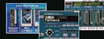
■ライブ・スイッチングで3種類のモジュールとして活躍。

●V-Synthの驚異的な音色創造力だけでなく、一台で3種類のシンセサイザーとして活躍●世界のプロが腕を競った即戦力パッチを搭載●簡単に素早く音づくりができるサウンド・シェイパー機能も搭載。