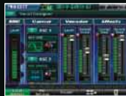
■ボーカル・デザイナー画面

圧倒的な人気のボーカル・デザイナーもV-Synth GTの基本機能として内蔵。驚異のヒューマン・ボーカル・モデリングにより、マイクを使って声を入力しながら鍵盤を弾くだけで、美しい大編成クワイアやポップス系バック・コーラスから、オーディオ・フレーズなどサンプル波形をキャリアにした独創的なボコーダー表現まで、人の声を自在にコントロール/モデリングできます。しかもデュアル・コア・エンジンにより、さらに進化、バリフリーズ機能や、アナログ・モデリングOSCによるV-Synthサウンド、APシンセシスとの同時使用が可能です。たとえば、バリフリーズとアルペジオが織りなす複雑なパッド音をスぺーシーなボーカル・アンサンブルで包み込むなど、これまでにない鮮烈なパフォーマンスを実現。マイク入力部には、標準タイプと、ファンタム電源供給も可能なXLRタイプの両端子を備えたコンボ・ジャックを採用。各種マイクの使用が可能です。