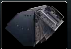
■マルチ・スタイル・ボディ&チルト機構。※チルト機構使用時は、ラック直上段に1U以上のスペースが必要です。