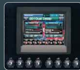
■タッチ・パネルとつまみで直感的な操作が可能。

高解像度TFTカラーLCDを搭載。カラー表現を生かした鮮やかなグラフィックにより、多くの情報をわかりやすく表示。視野角も広く、サウンド・メイク時の視認性も大幅に向上。もちろん、LCD画面に触れるだけでエディットが進むタッチ・パネル仕様。目的の項目にダイレクトにアクセス可能です。さらにLCDの下には、画面と対応して直感的にコントロールできる8個のつまみを装備。またジョグ・ダイヤルとカーソル・ボタンの一体化や、Dビームをはじめ、リアルタイム・コントローラー群を同エリアに集中配置して、操作をスピード・アップ。リアルタイム・パフォーマンスの演奏性を大きく向上させました。