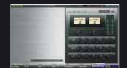
■マスタリング・エフェクト画面