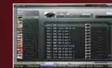
■パッチ・リスト画面

Fantom-Gシリーズは、その心臓部のサウンド・エンジンから新開発。従来の2倍のウェーブ容量に達する大規模な音源システムを構築。この圧倒的な進化と余裕により、内蔵音色をリニューアルしました。なかでも、ステージ・キーボードの核となるピアノ音色には特別なこだわりをもって設計。Fantom-Xで世界中のアーティストから絶賛された88鍵ステレオ・マルチサンプリングによるピアノ音色も、Fantom-Gのために新規サンプリング。さらなる高次元へとグレードアップしています。また、ライブを圧倒するシンセサイザー・サウンド、楽曲制作の基本となるドラム、ベース、ストリングス系などもいっそう強化。フルート、オーボエなどウィンド系も新規サンプリングによるパワー・アップ・バージョン。いずれもミュージック・シーンを一気に新たなクオリティ・レベルへと引き上げる、衝撃の表現力をもつ音色群です。このシンセサイザー音源とともに、サンプラー専用機をも凌駕するほどの完成度に達した、Fantomならではの高度なサンプリング機能を搭載。マイクや外部オーディオ機器入力、パソコンからUSB経由で録り込んだサンプルを、シンセサイザー音源の波形と同様に扱うことが可能。さらに、即興的な演奏も録り逃すことのないスキップバック・サンプリングもFantomならではの装備です。