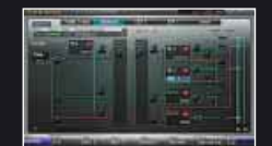
■エフェクト・ルーティング画面