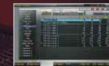
■パッチ・プロ・エディット画面