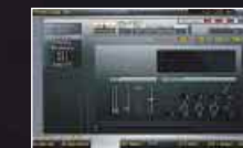
■パッチ・ズーム・エディット画面