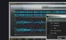
■サンプル・エディット画面