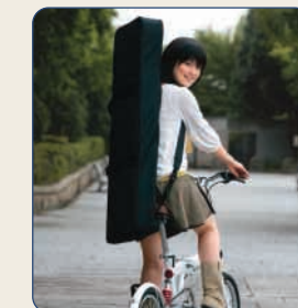
■どこでも連れ出せる軽量ボディ。

どこでもラクラク持ち運べる軽量5kgのライトウェイト・ボディです。マイルームでも使いやすく、さらにスタジオへ、ステージへ、ストリートへ。あなたと一緒にどこへでも連れていけるフットワーク抜群の行動派シンセです。