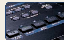
■音色選びは素早くダイレクト。

内蔵音色を、ピアノ、ギター、オーケストラ、ブラスなど、楽器カテゴリーで分類したダイレクト・アクセス・ボタンに集約。目的のカテゴリーの音色を素早く選べます。さらに音色づくりも専用の5つのつまみにより、サウンドの明るさ、暗さ、立ち上がりの鋭さ、余韻の長さなどを直感的にコントロールできます。