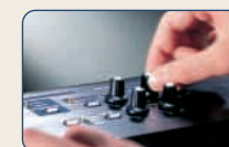
■音づくりも直感的でシンプル。