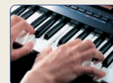
■ピアノやエレピも気持ちよくプレイ。

鍵盤がいいから、気持ちよく演奏できるシンセです。鍵盤タッチを最優先にして開発され、ダイナミックかつ繊細にシンセ・プレイを満喫できる新鍵盤を採用。ピアノなどタッチの微妙なニュアンスが大切な音色も豊かな表現力で演奏できます。