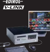
※ディスプレイは別売です。