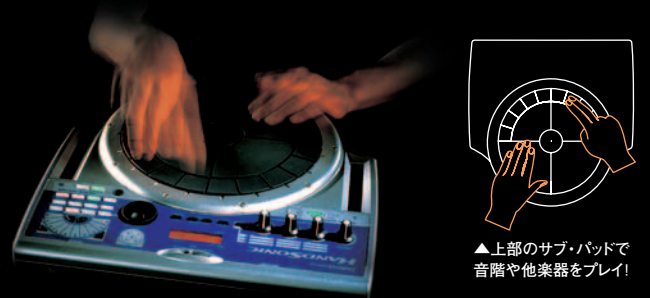
▲上部のサブ・パッドで音階や他楽器をプレイ!